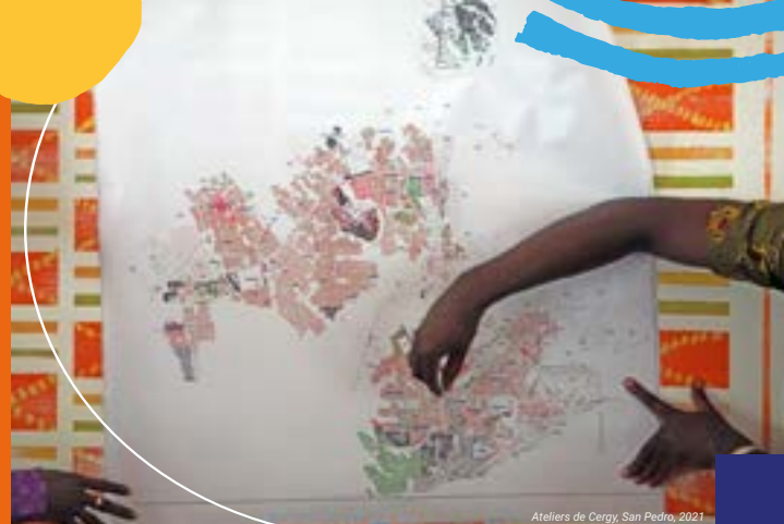
Ateliers de Cergy, San Pedro, 2021

Afin de permettre aux participants d'être acteurs de leur formation et de les placer en situation de production pour la résolution de problèmes, le parcours de formation Urban prospective lab est centré autour d'un cas concret. En 2022-2023, la ville-école de Bohicon (Bénin) constitue le terrain d'analyse et de propositions. Tout au long du parcours, les problématiques de la ville-école sont mises en perspective avec les villes des autres participants.