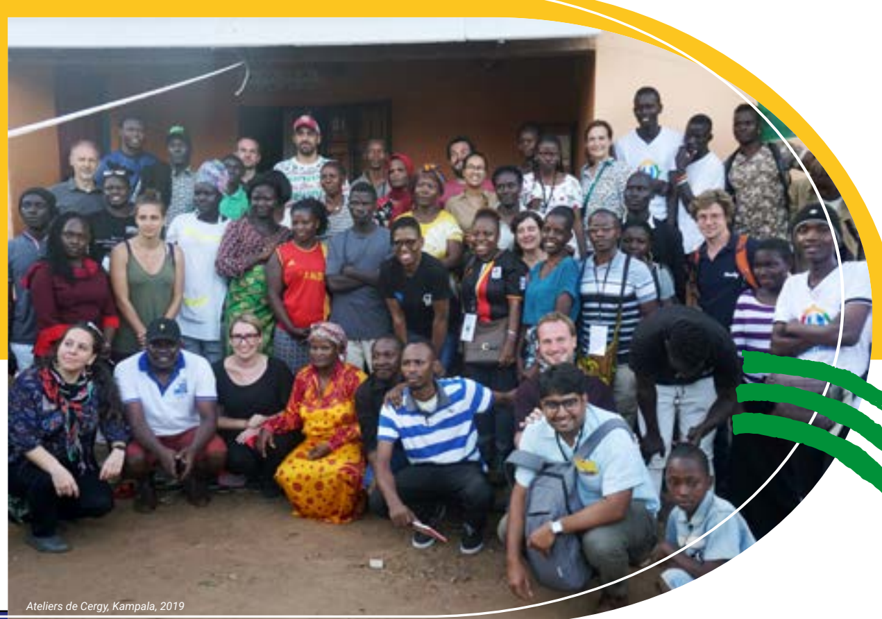
Ateliers de Cergy, Kampala, 2019

Le défi est de proposer de nouveaux récits pour ces villes intermédiaires ; de promouvoir des visions renouvelées, partagées et d'identifier des solutions adaptées pour un développement durable de ces territoires.