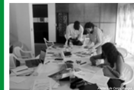
Ateliers de Cergy, Bangui, 2018