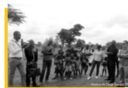
Ateliers de Cergy, Bangui, 2018