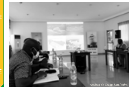
Ateliers de Cergy, San Pedro, 2021